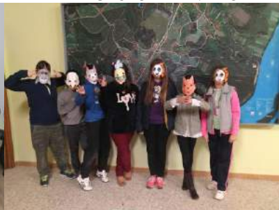
GRUPO DE PIÑEIRO