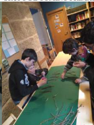
GRUPO DE TOMIÑO PRIMARIA