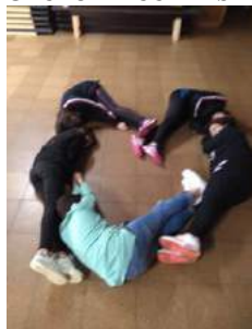
GRUPO DE CURRÁS