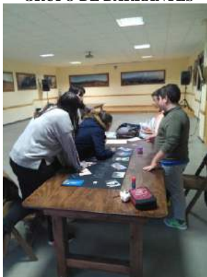
GRUPO DE BARRANTES