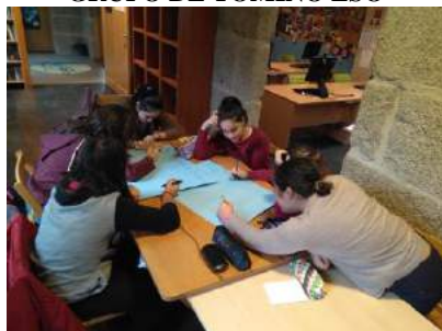
GRUPO DE TOMIÑO ESO