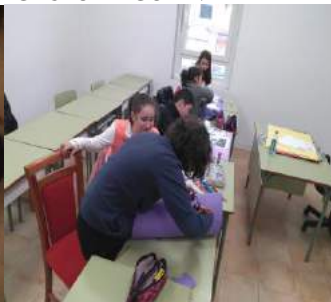
GRUPO DE GOIÁN PRIMARIA