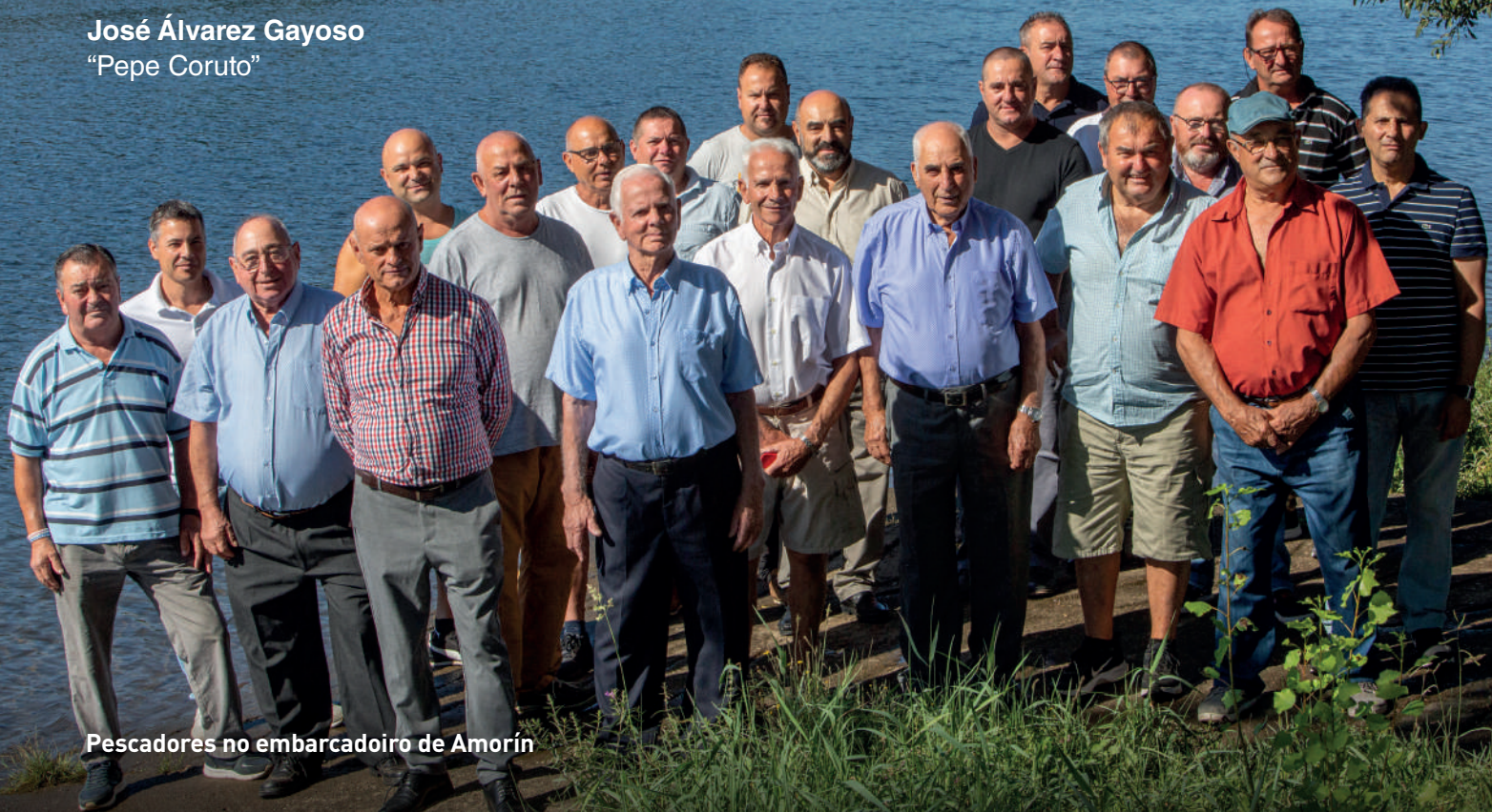
Pescadores no embarcadiro de Amorín